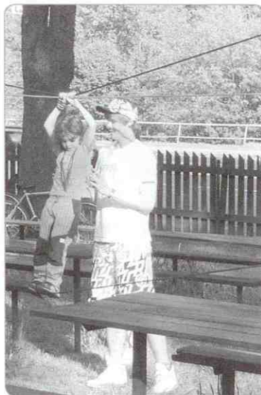
Jeden z úkolů - lezení po laně.

laně, dále děti stavěly komíny, skládaly obrázky a vyráběly čelenky. Za splnění všech úkolů děti dostaly drobné překvapení v podobě sladkosti a malého mydélka na cestování. „Dětem se nejvíce líbily velké křídly, kterými mohli neomezeně malovat,“ podotkla pani Křenková. O zábavu bylo postaráno. Děti si mohly dát v místním bufetu dobrou zmrzlinu, rodiče točenou kofolu, nebo pivo. Závěrem si společně opekly špekáček a zaskočily na taneční muziku. „Nás pořadatele moc těší, že se rodiče dokážou věnovat svým dětem a spojit svůj úspěšný život s pěkně prožitým dnem,“ dodala pani Křenková. Další akce, kterou pořádá SVČ Rožnov pod Radhoštěm společně s Nero Trade, se koná již tento pátek 24. 6. opět v parku U Zavadilky a jmenuje se Škola končí, léto začíná. Srdečně zvou pořadatelé. -š-