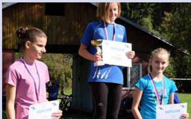
Vítězové obdrželi poháry, ostatní umístění drobnou věcnou cenou