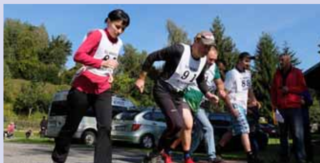
Start Kněhyňské míle (závod amatérů)