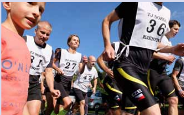
Společný start mužů a žen, kteří běželi 10 km (muži) a 5 km (ženy)