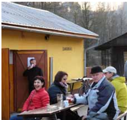
Zahradkáři připravili domácí zabijačku