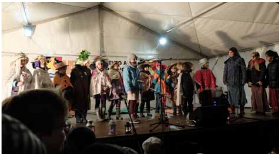
Vystoupení dětí ze ZŠ