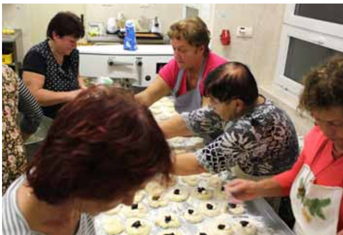
Členky spolku Sakumpikum při přípravě na rozsvícení