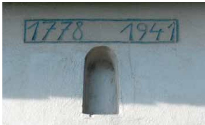
Vročení na štítě budovy bývalého prostřednobečvanského fojství.