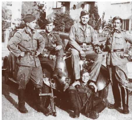
Vojáci Rudé armády