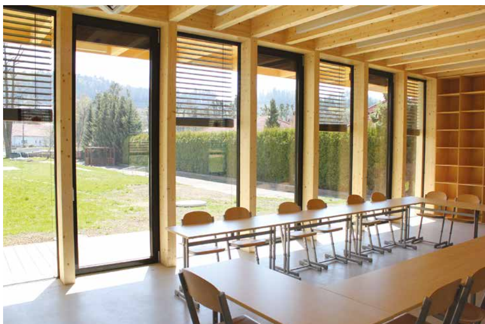
interiér nového pavilonu ZŠ