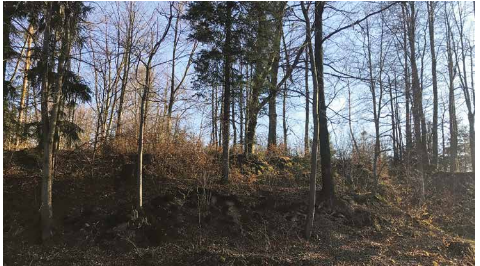
Zákopy na Nové

na kopání zákopů na obranu proti postupující Rudé armádě. Zejména se nacházely v zatáčce u hostince Nová, odkud byl dobrý výhled na hlavní tah ze Slovenska. Hlavní silnice tenkrát vedla po tomto břehu řeky Bečvy. Tyto zákopy jsou patrné dodnes ve svahu pod domem paní Uhlářové. Na silnicích byly Němci stavěny z klád bariéry a zátarasy, které se však vůbec neupotřebily.