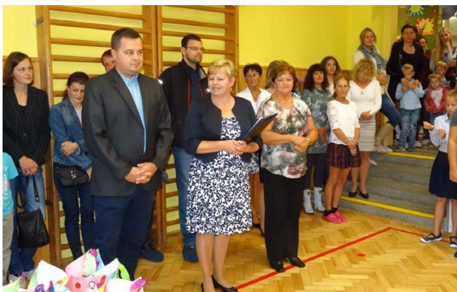
Zahájení školního roku.