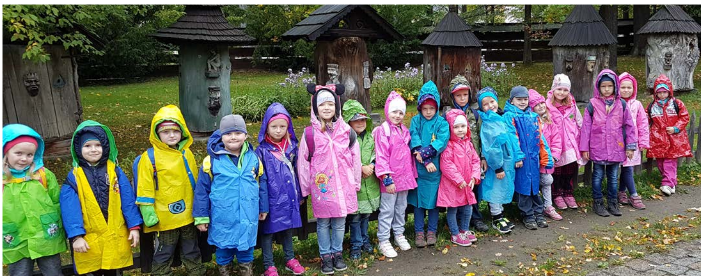
Návštěva Valašského muzea v přírodě.