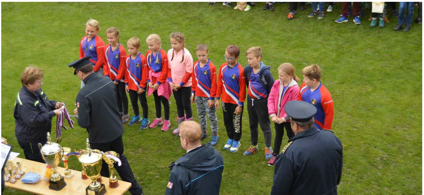
Putovní pohár ředitele HZS Zlínského kraje - mladší žáci 1. místo.