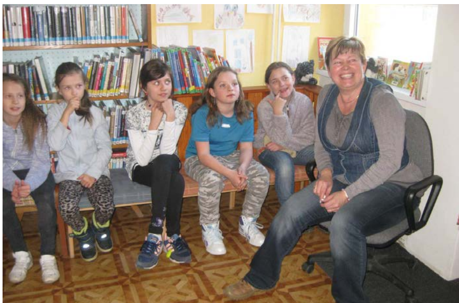
Společně s žáky.