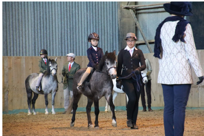
Show and Ride šampionát. Další fotografie na webu obce.