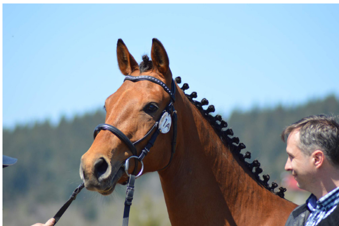
Šampionka teplokrevných koní Fella-Z.