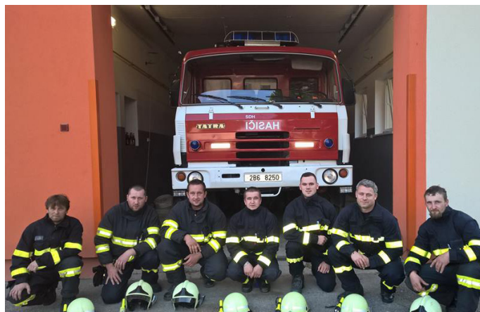
JSDH Prostřední Bečva Kněhyň s novou Tatrou.