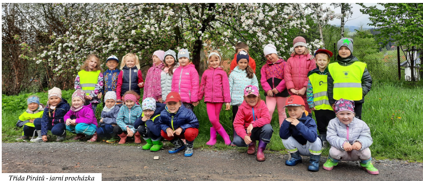
Třída Pirátů - jarní procházka

Obě mateřské školy opět otevřely své dveře 12. dubna, a to nejdříve pouze pro předškolní děti a děti rodičů IZS. Využili jsme tak každý den intenzivní přípravou předškoláků na vstup do první třídy. Tato příprava vyvrcholila v MŠ Kněhyně i v MŠ střed zkušební „zápisem“ do první třídy, při kterém si děti vyzkoušely různé úkoly