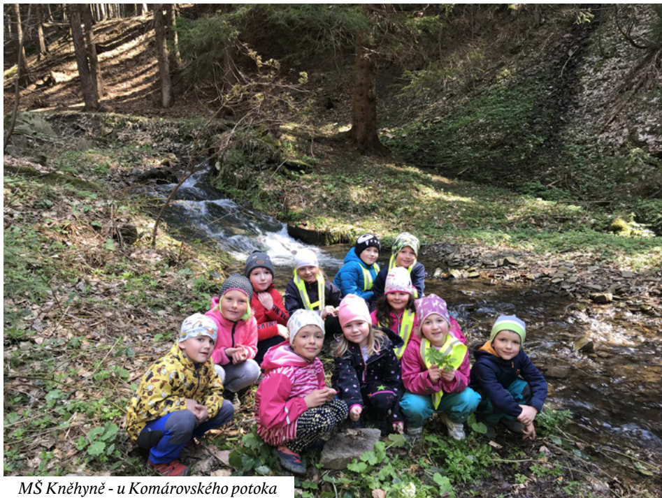
MŠ Kněhyně - u Komárovského potoka

rostlinky. Děti se také velmi těší na novou část školní zahrady, která se právě buduje. S dětmi trávíme co nejvíce času venku (pokud to počasí dovolí). S předškoláky